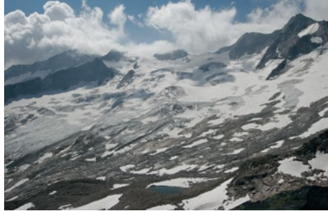
Klimawandel: Herausforderung von strategischer Bedeutung